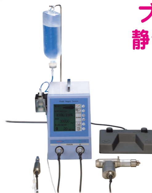
Osada Surgery Success V オサダサージェリーサクセスV